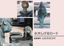
水木しげるロード 銅像場所 福地越前清市

世界一のブロンズ銅像のまちを自負する高岡では、全国にある銅像（ブロンズ像）やお寺の彫り物のほとんどをつくっています。あなたも知っている人気キャラクター像もきっと高岡産まれです。そんな「高岡っ子」のはんの一部をご紹介します。